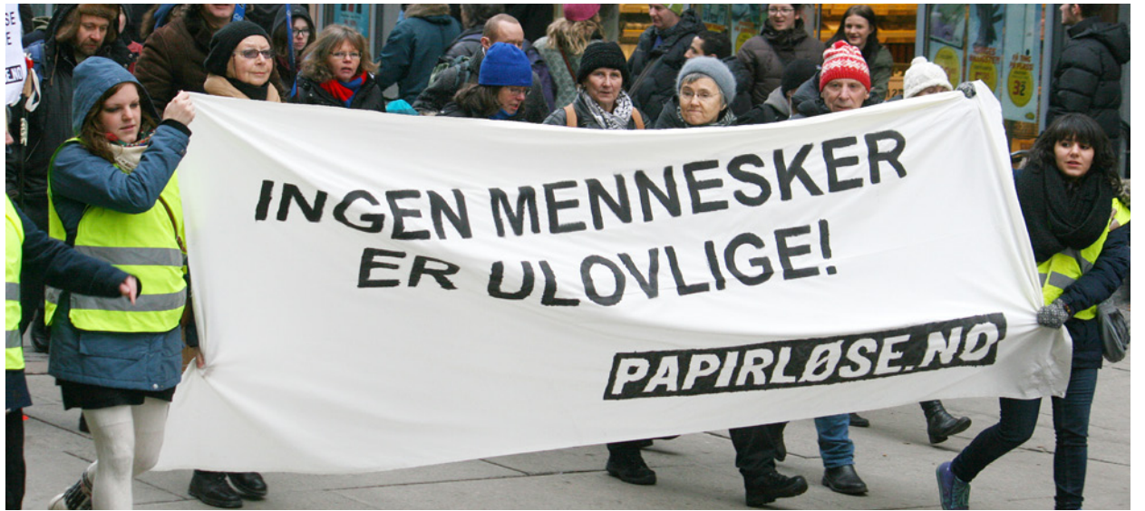
Rettsikkerhet: Rødt vil erstatte Utlendingsnemnda med en asyl-domstol.