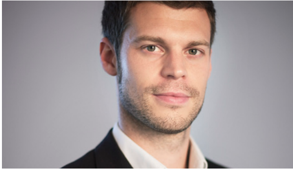
Rødt-nestleder: Bjørnar Moxnes.