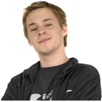
Ser framover: Fredrik V. Sand.