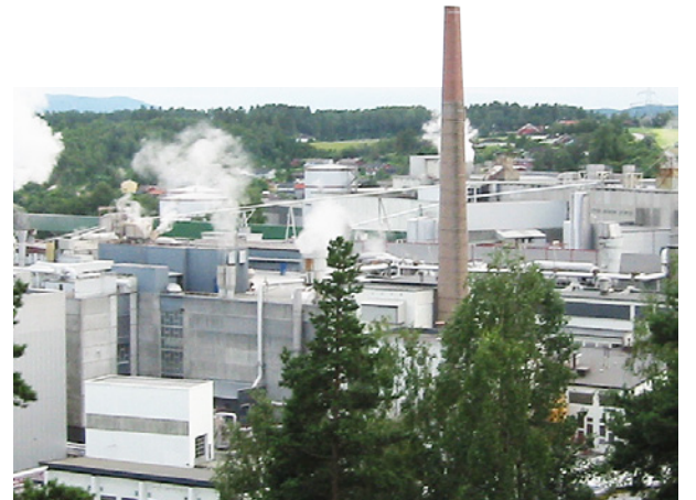
Snart slutt: Norske Skog Follum står overfor nedleggelse.