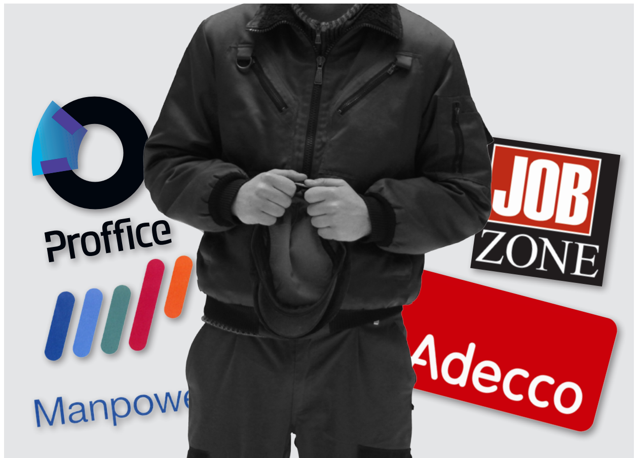
Med lua i handa: Arbeidsfolk taper på at vikarbruken blir mer utbredt. Illustrasjon: Rødt Nytt.

– Vi må kreve at regjeringa legger ned veto, at de innfører søksmålsrett og at fast stilling fortsatt er det vi skal ha i morgendagens arbeidsliv, sier hun.