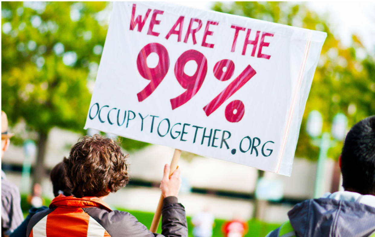
Occupy Wall Street: Slagordet We are the 99% retter seg mot den amerikanske overklassen.