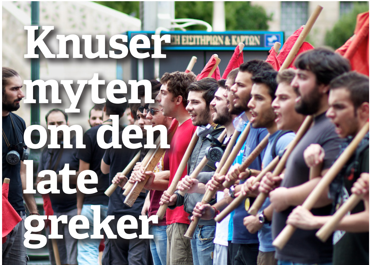
Hellas: Grekerne er tungt rammet av økonomisk krise.

Folkvords bok Vår korrupte hovedstad kan bestilles fra marxisme.no